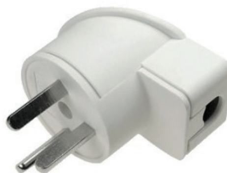
Voorbeeld: HNA-stekker haaks, wit